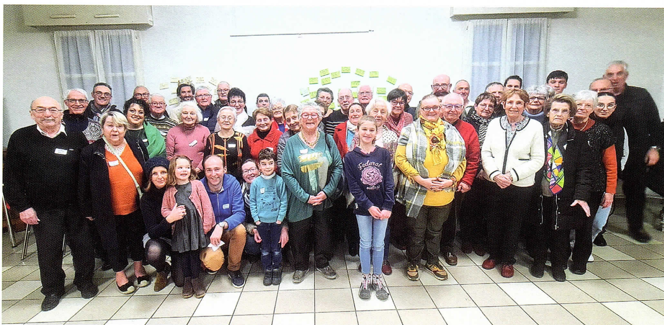
La rencontre en Auvergne.

« Venez et vous verrez ! » C'était le thème de l'évangile du jour.